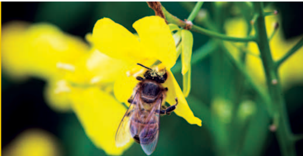
Abeille butinant des fleurs de colza, Allemagne.